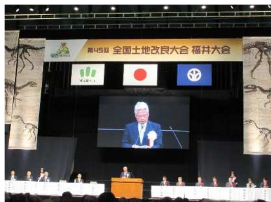
二階全土連会長の挨拶を代読する義経副会長