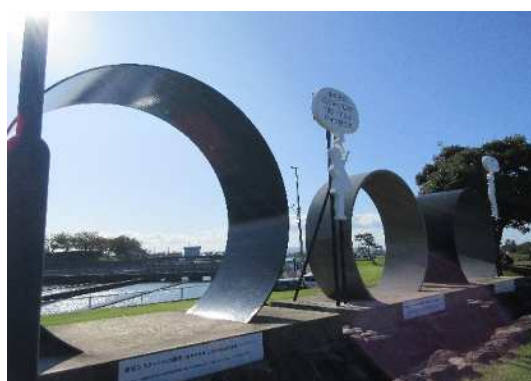
このパイプラインが埋設