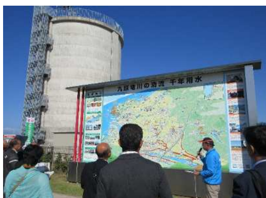
かんがい施設の説明を受ける

国営かんがい排水事業で整備された九頭竜川下流地区のかんがい施設は、4市町にまたがり、受益面積が11,642haという大規模なものです。幹線用水路は54.8km、パイプラインの最大口径は3.5mもあり、広域の水田地域に農業用水を安定的に供給しています。