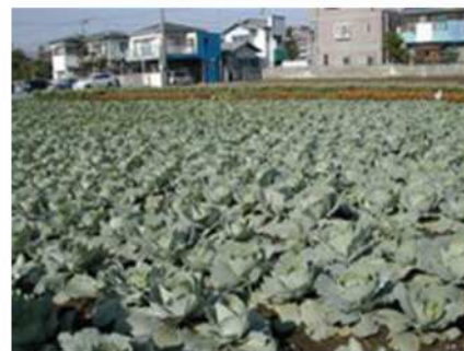
都市の農業（練馬区・キャベツ畑）