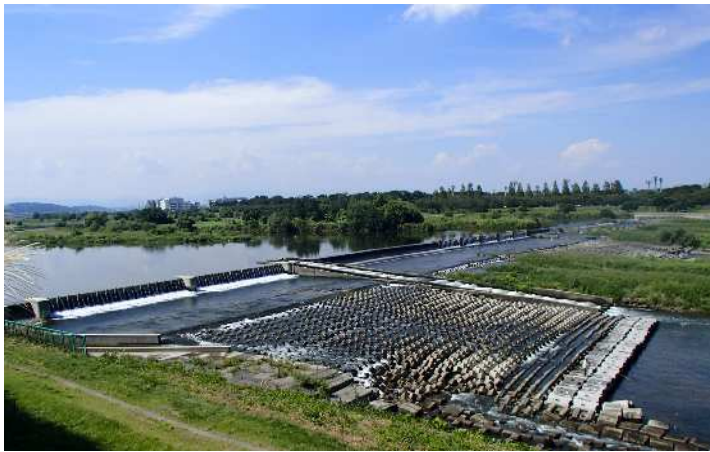
大丸頭首工（大丸用水土地改良区）

さらに、農地の保全、農地の創出、多面的機能の発揮に向けた取組を都内全域で推進する新しい事業『未来に