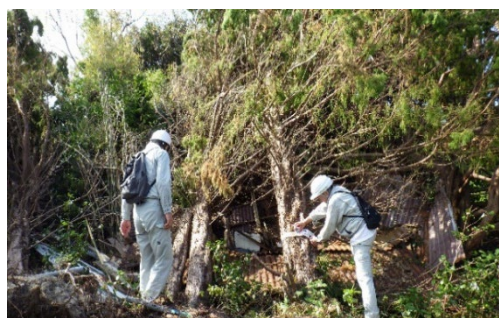
台風15号 倒木状況（新島村）