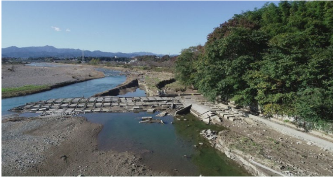
台風19号 堰の損壊（あきる野市）