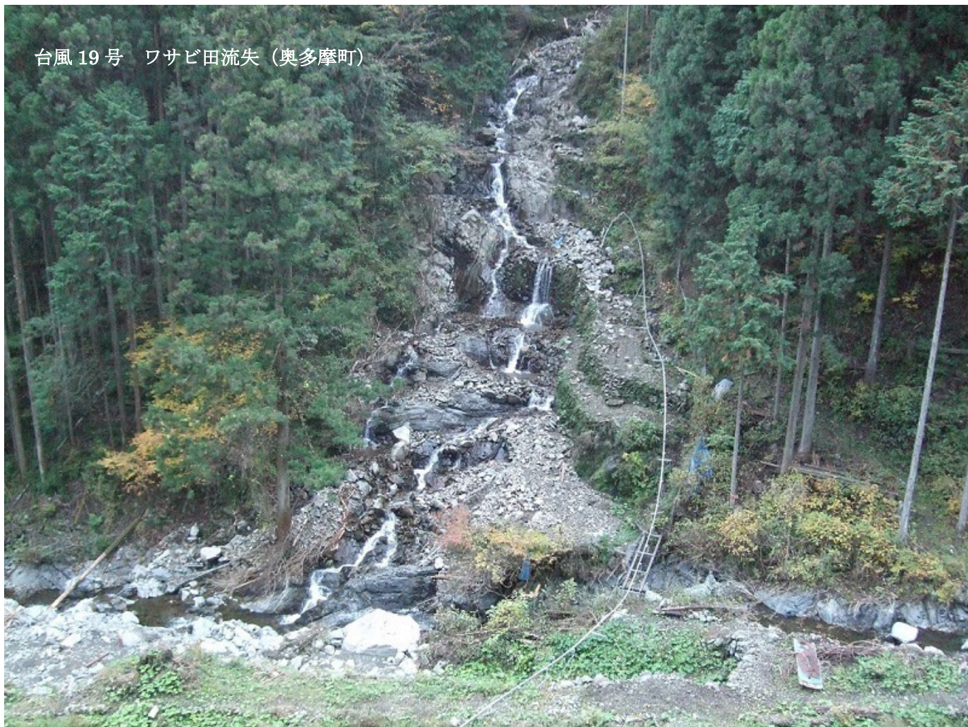
台風19号 ワサビ田流失（奥多摩町）

昨年9月、台風15号は伊豆諸島や千葉県を中心とした関東地方に強風による大きな被害をもたらしました。そしてそのわずか1か月後の10月、再び関東地方を大型で強い台風19号による大雨が襲いました。